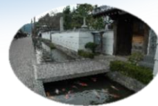
特別メニュー 特別宿泊プラン