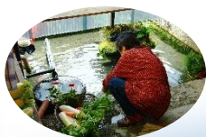
まち歩き P G 体験 P G