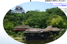
イベント 着地型ツアー